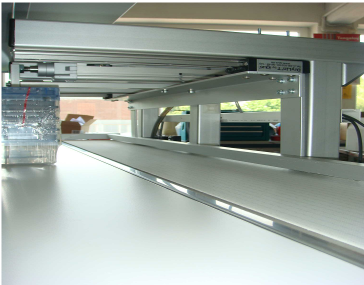
Abb. Abschiebeeinheit des Gruppierförderbandes