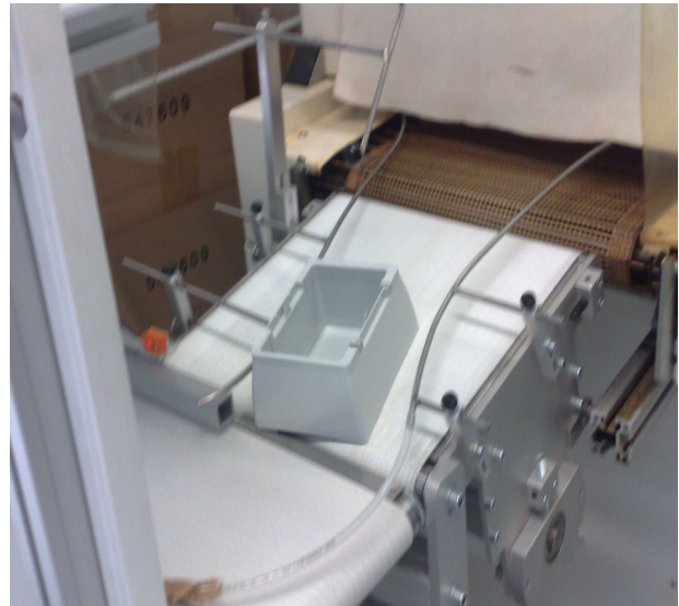
(Abb. Oben Zulaufförderband )