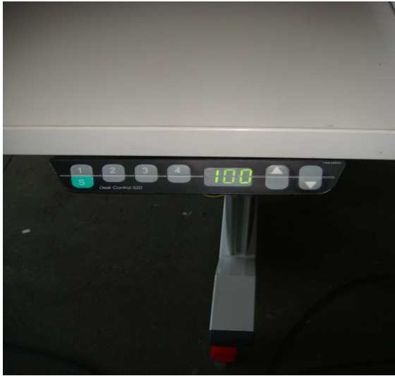
(Abb. Elektrische Höhenverstellung des Arbeitstisches)